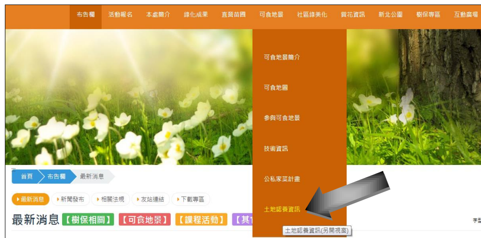
本府綠美化環境景觀處網站增設「土地認養資訊」連結