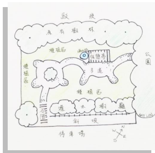
社區規劃師入選公告及初步設計圖說