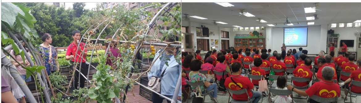
里長分享可食地景經驗