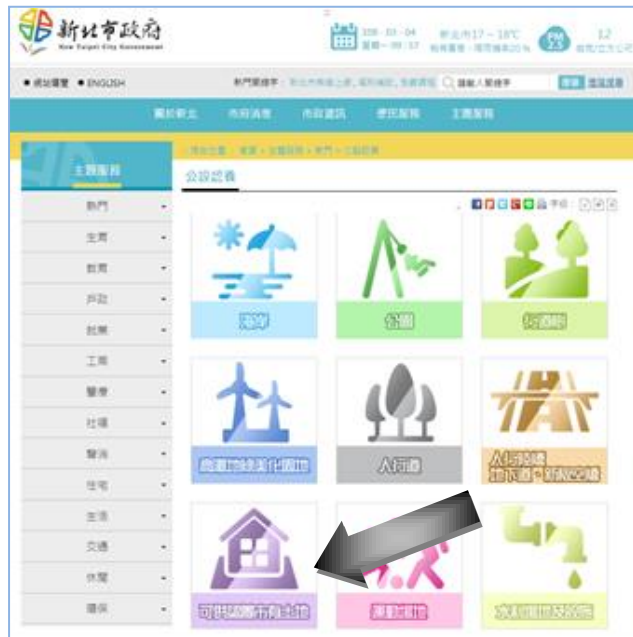
新北市政府網站熱門主題蒐尋→公設認養→可供認養市有土地