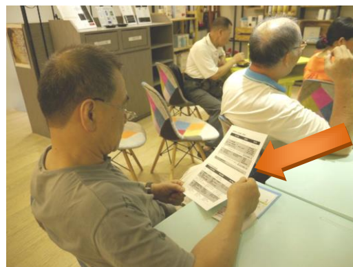
本府城鄉局社區規劃師說明會 DM