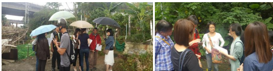
107 年 4 月 3 日、107 年 9 月 27 日輔導團隊輔導情形

本局設置認養聯絡諮詢窗口，並成立輔導團隊(本局、景觀處、區公所等組成)安排有認養意願者至現場實地勘查，協助規劃綠美化、提供種植建議、媒介各局處可用資源及解說簽約注意事項，使認養意願者於第一時間即能透過單一窗口諮詢及輔導團隊建議獲得充分資訊，降低認養障礙，並於認養期間持續協助聯繫相關資源，輔導團隊共同訪視輔導種植情形等，藉此單一窗口及輔導等友善流程服務推動認養，已確實有效提升認養意願及加強綠美化效益。