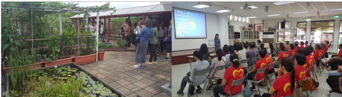
三德活動中心綠屋頂農場

本局於推廣前期持續請區公所協助尋找有認養意願之里長、里民及志工，並於 107 年 5 月邀集有認養意願之里長、里民與區公所、本府綠美化景觀處等輔導團隊成員共同參訪本市三德及興華活動中心辦理開心農場、綠屋頂等利用，藉由參訪加強推廣認養機制，積極媒合認養，並同時宣導性別意識，鼓勵女性參與認養。