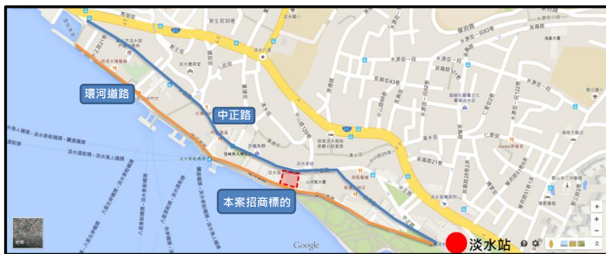
圖 2 招商標的位置圖

淡水為目前新北市最熱門景點之一，年遊客數高達 330 萬人次，位居新北市熱門景點第 3 名，本案招商標的即座落淡水老街商業軸帶，距捷運淡水站僅 300 公尺，周邊商家林立。