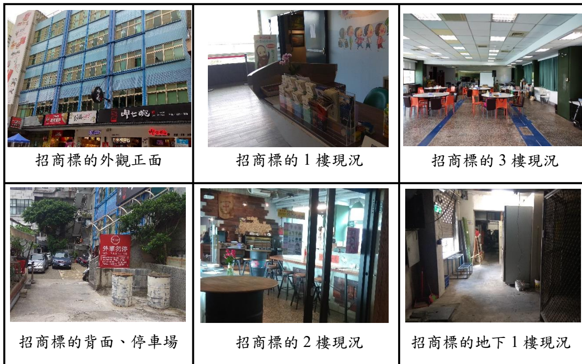
圖 3 招商標的現況圖