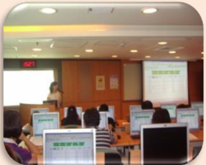
辦理臺北惜物網拍賣教育訓練